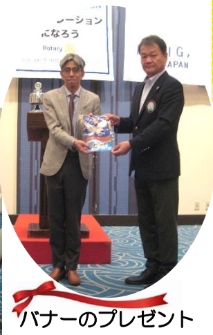
バナーのプレゼント