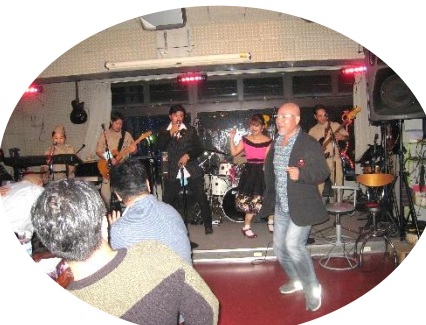
歌って♪踊って♪ とっても楽しい一夜でした🍷