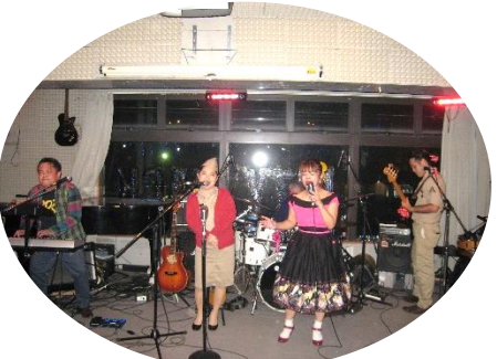
1 ステージの予定が盛り上がり 2 ステージ歌って頂きました♪