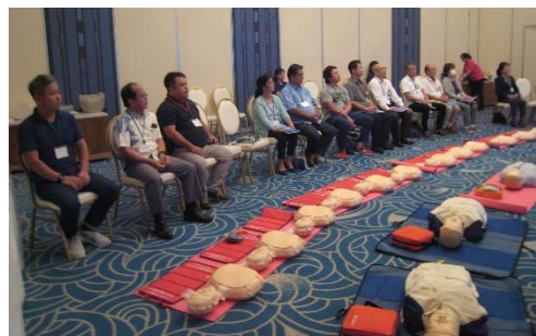
全員合格いたしました!