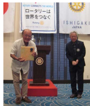
祝古希上勢頭保氏