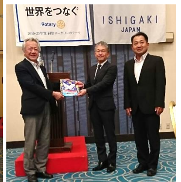
🎀 パナーのプレゼント