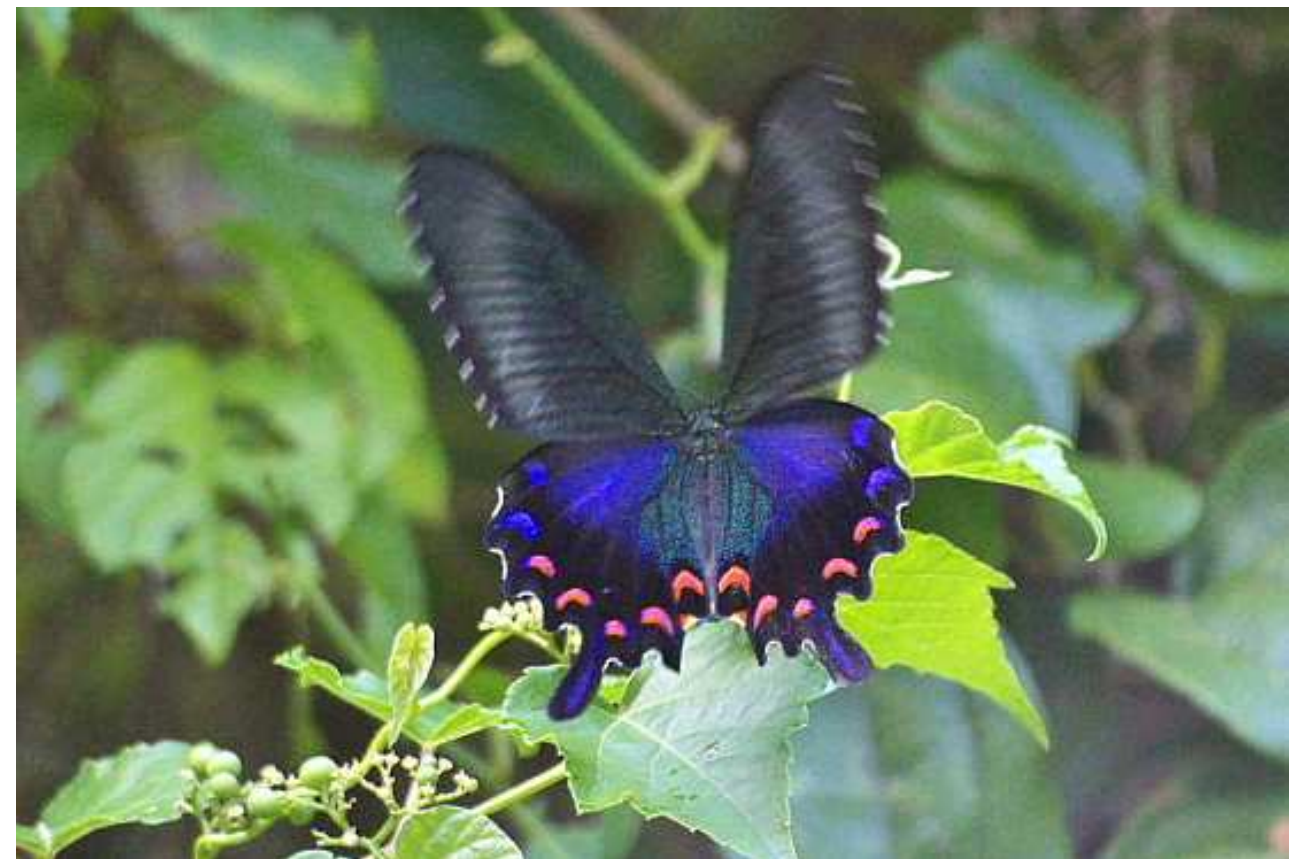
●オキナワカラスアゲハ(アゲハチョウ科)

翅の形が四角い感じで、翅の表面の色はより暗く地味で、後翅に散らばっている青色鱗は基半部のみに見られ、外半部にはほとんど見られない。しかし後翅の青色弦月紋(げんげつもん)、赤色弦月紋はよく発達している。